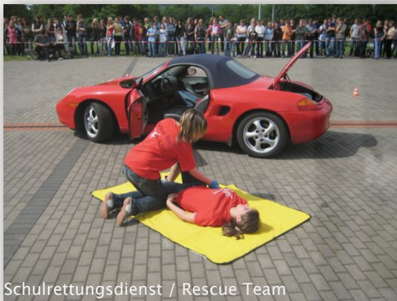
Schulrettungsdienst / Rescue Team